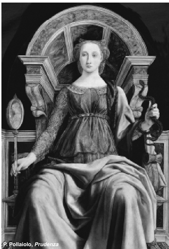
P. Pollaiuolo, Prudenza

Roma. La fondazione Memmo a palazzo Ruspoli, propone sino al 27 gennaio la mostra Da Cranach a Monet. Rassegna che porta in Italia 57 dipinti della celebre collezione Pérez Simón di Città del Messico. Aprono il percorso (che va dal XIV al XX secolo) i capolavori italiani e tedeschi e lo chiudono quelli di Pissarro, Monet e Gauguin. H. tg 10-19,30 da venerdì a domenica fino alle 20,30.