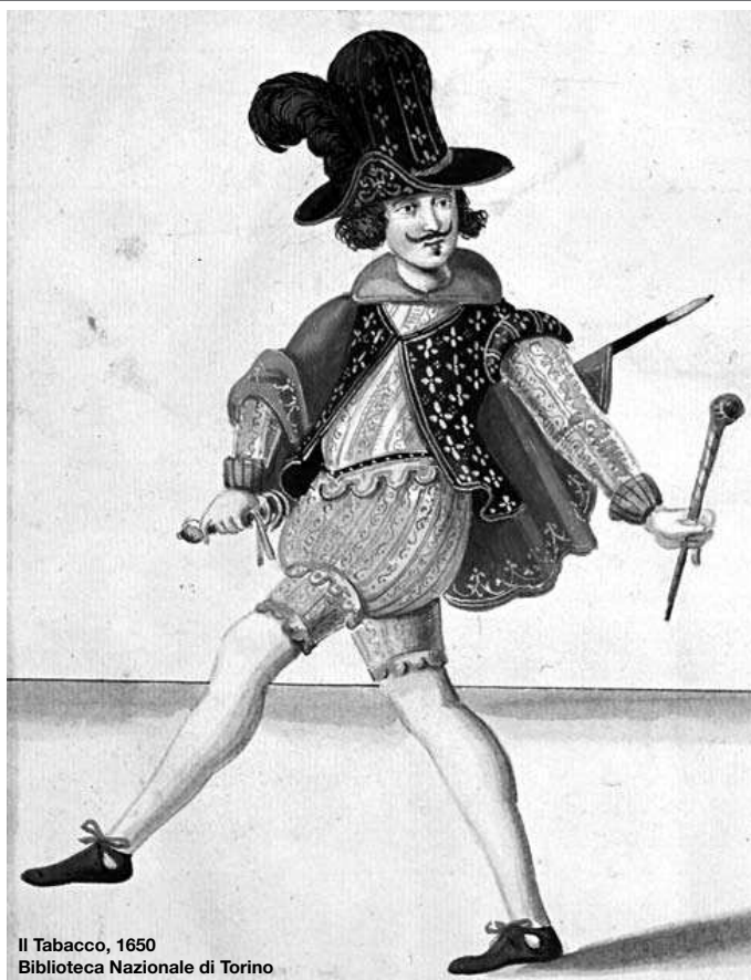
Il Tabacco, 1650 Biblioteca Nazionale di Torino

L'Accademia di Francia, fino al 24/5, mette in mostra Granet, Roma e Parigi, la natura romantica . Un centinaio di opere (tra oli e acquerelli) consentono di osservare il lavoro di Fran-